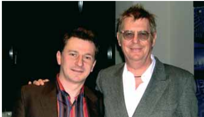
Wolf Prix: Autor de la nueva sede del Banco Central Europeo y de la sede de BMW.

Nos hallamos ante un enorme reto. El equipo de trabajo se ha puesto en marcha. Es hora de definir el programa de necesidades del nuevo equipamiento y ajustarlo al presupuesto previsto. Este proceso que se desarrollará en los próximos meses es de vital importancia, de él depende el éxito final. Y es precisamente aquí donde dos empresas de