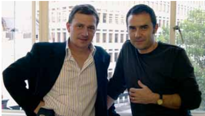
Alejandro Zaera arquitecto español emergente de mayor proyección internacional.

“Gure tamainaz eta ditugun mugetaz jabe gara ahal dugun proiekturik onena osatzeko, eta lan horretan amaiera arte jarraituko dugu”.