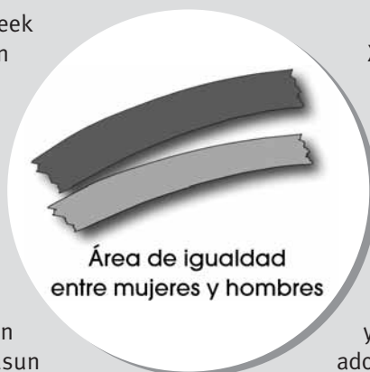
Área de igualdad entre mujeres y hombres

Emakume eta Gizonen arteko Berdintasun arloaren futsezko helburua ekonomia, kultura eta gizarte bizitzako arlo guztietan emakumeen eta gizonen benetako eta egiazko berdintasuna lortzea da. Horrela pertsona orok beren gaitasunak garatu eta erabakiak hartu ahal izango dituzte, ohiko rol sexualen baldintzarik gabe.