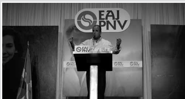
Joseba Egibar Gipuzku Buru Batzarreko lehendakaria bere hitzaldia ematen.

A continuación el presidente del Euzkadi Buru Batzar, Josu Jon Imaz, subió al estrado. El verano vivido, el proceso de paz y el futuro que viene, fueron los temas en los que basó su discurso. Imaz aseguró que este verano ha sido un verano tranquilo, salvo por las incursiones del “duo Pimpinela” refiriéndose a PSOE y Batasuna, y por “los comunicados del primo de Zumosol” en referencia a ETA. Pese a todo, opinó que el proceso avanza y que las cosas no van mal porque los pasos que se tenían que dar se están dando. El presidente del Euzkadi Buru Batzar advirtió tanto al PSOE como a la Izquierda Abertzale de que nadie va a entorpecer la voluntad de los vascos, por lo que pidió que no entorpecieran el proceso de paz con estrategias para evitar el debate político o para retrasar la mesa de partidos. Por ello, Josu Jon Imaz pidió que nadie amenace con una vuelta atrás, y menos ETA, ya que si ETA diera marcha atrás