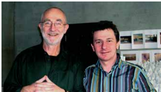
Peter Zumthor poseedor de los premios Mies Van der Rohe y Carlsberg.

Atzerako kontaketa hasi da. Pasatako ekainaren 14ean IDOM eta ARTEC enpresek Zarauzko Arte Eskenikoen Gune-ko aholkulariak eta kudeatzaileak izateko kontratuak sinatu zituzten. Horrela zarauztarrok dugun amets bat bihurtuko duen proiektuaren partaide izatera pasa dira.