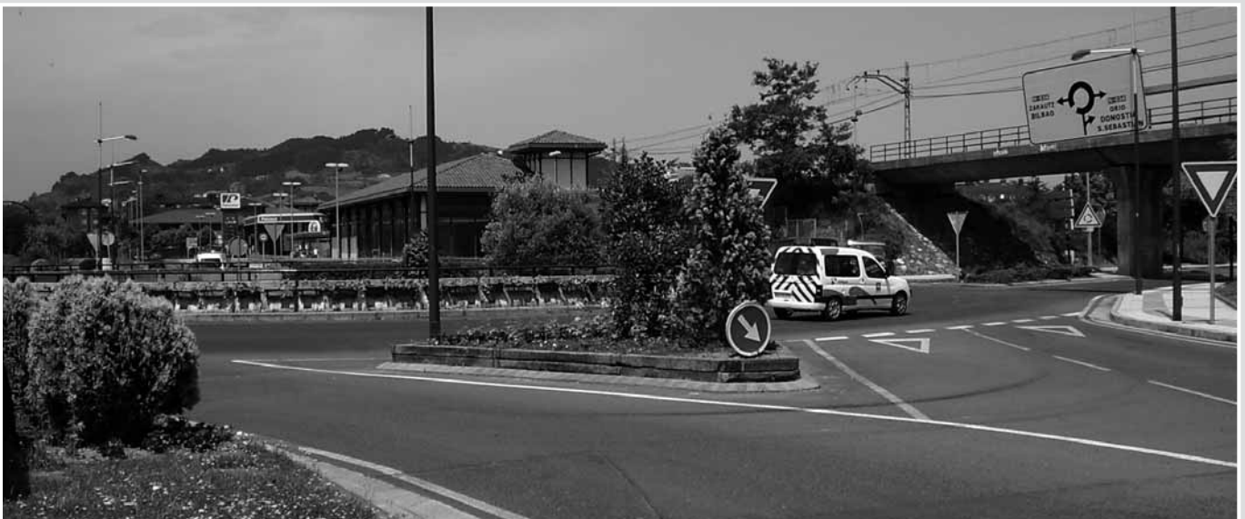
Rotonda de Asti donde se tomará la variante.

La Diputación Foral de Gipuzkoa y el Diputado General, el zarauztarra Joxe Juan Gonzalez de Txabarri, han mostrado su compromiso con Zarautz e invertirán 44 millones de euros en la construcción de esta variante que comenzará en 2007 y que permitirá liberar al casco urbano de Zarautz del paso de unos 20.000 vehículos al día.